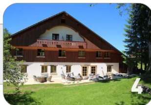
Hôtel Restaurant Le Tillau T +33 3 81 69 46 72 www.letillau.com