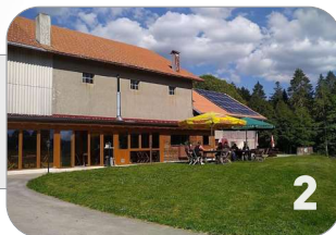
Auberge Au pied de cochon T +41 79 648 13 33 www.aupieddecochon.ch