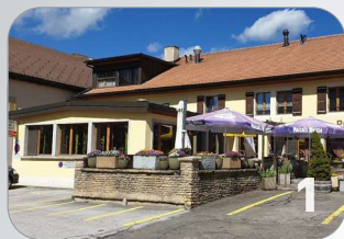
Hôtel Restaurant de la Poste T +41 32 865 10 94