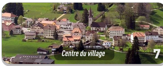
Centre du village