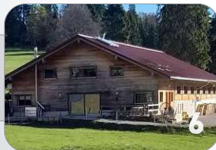
Auberge du Chalet des Prés T +41 32 865 11 75