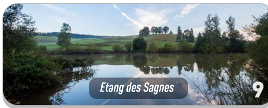
Etang des Sagnes