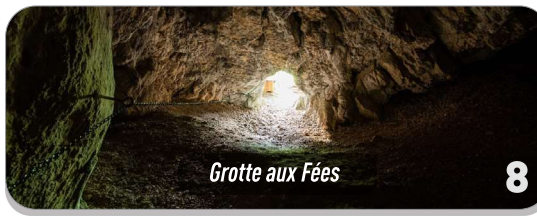
Grotte aux Fées