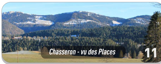
Chasseron - vu des Places