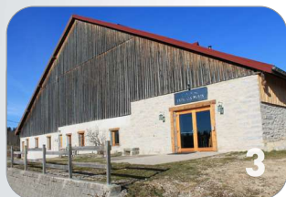
Auberge Entre ces Monts T +33 7 88 17 99 83