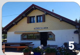
Auberge du Mont-Barres T +41 32 866 14 58